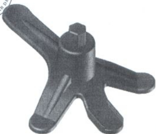
1.3 Plastik Boru Kaynak Makinası Gövdesi